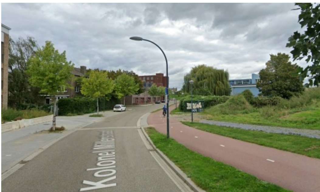
Coördinaten (Google Maps):